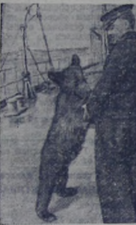
Воспитанник линкора «Севастополь» — бурый Мишка, влюблённый любимец корабля.