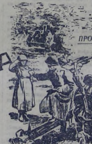
— Красноармеец Солнцева! — сказал Енакиев так громко, чтобы услышали все.

(Рисунок худ. И. ГРИНШТЕЙНА по книге «Сын полка».)