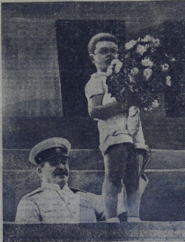
Самые юные участники Всесоюзного парада физкультурников преподнесли товарищу Сталину цветы. С ласковой, отеческой улыбкой благодарил Иосиф Виссарионович ребят. На снимке: на трибуне мавзолея.

Площадь как бы окрашивается в сине-голубой цвет. Это форма физкультурников трудовых резервов,