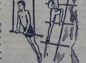
На этом рисунке показаны различные виды применения пионерского посоха.