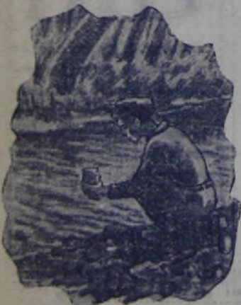
На берегу реки в нашей необычный камень. (К заметке Л. Парадеева).