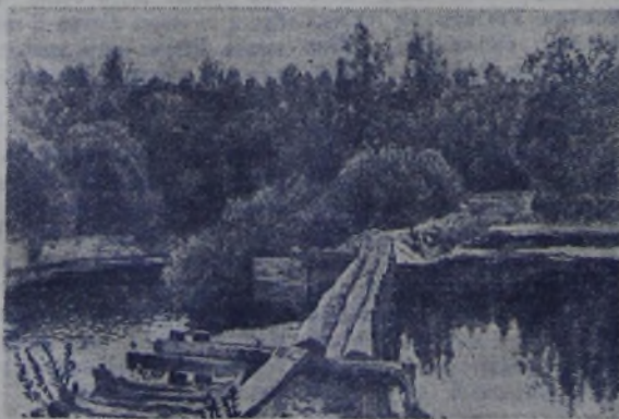
И. Левитан. «У омуля».

чайную и тихую прелесть природы средней России, был Исаак Левитан.