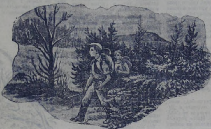
Уже несколько лет мы изучаем свой край. (К заметке Л. Ивановой).