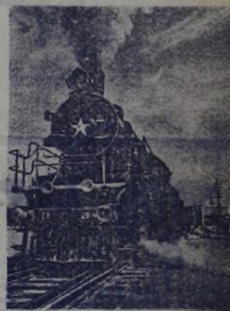
Между Москвой и Берлином установлено прямое пассажирское сообщение. На снимке: экспресс Москва—Берлин в пути.

Он был твёрд, вынослив, дисциплинирован. Таким его воспитала школа. И мне хочется прибавить: таким его воспитывали и отец и мать.