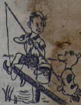
Обучает Речка Боря И даёт ему наказ: — Если ты заметишь вора, Задержи его тотчас! —