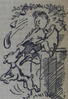
Не спуская с груши взгляда, Боря ходит возле сада. Только ногу он занёс, Как в штаны вцепился пёс. Борей заданный урок Твёрдо выучил щенок. МАКАР СКРИПКИН.