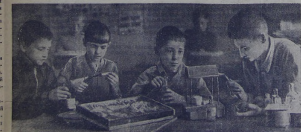
На станции юных краеведов. Надо привести в порядок материалы, собранные в походах. Ребята готовят гусениц для коллекции насекомых.

Ребята зарисовали свои находки. Мы помещаем часть этих рисунков.