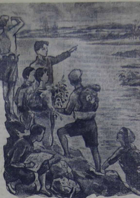
Рисунок Л. Снехова.