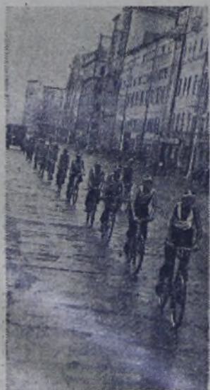
На днях в Москве финишировали участники велопробега Ленинград—Москва учащиеся 32-й мужской средней школы Ленинграда. На снимке: участники пробега на улице Горького в Москве.

Это одна из главных причин, побудивших большинство избирателей отдать свой голос лейбористам. В памяти английского народа ещё свежо воспоминание о той ужасной безработице, которая была после первой мировой войны. Народ Англии не хочет повторения печального опыта прошлого.