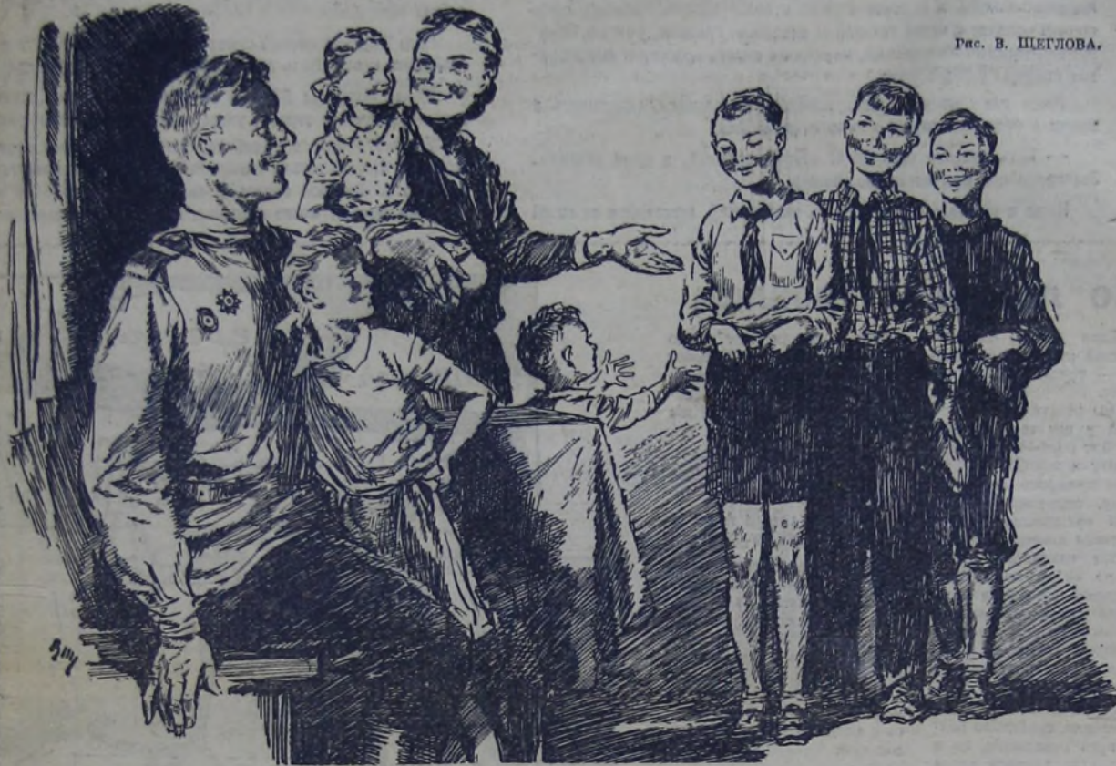
Рис. В. ЩЕГЛОВА.

В этом доме пионеры-тимуровцы были внимательными и заботливыми помощниками и стали всем близки и дороги. Сегодня домой возвратился тот, кого здесь так ждали: отец-воин. И сегодня же пионеры пришли поздравить его. С какой теплотой счастливая мать рассказывает об этих трудолюбивых и скромных мальчиках, об их славных патриотических делах!