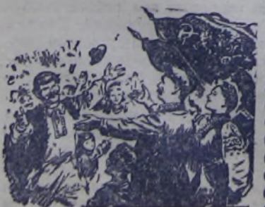
Рисунок В. ШЕГЛОВА.

Народы Советского Союза широко открывают братские объятия для закарпатских украинцев — новых членов нашей великой советской семьи.