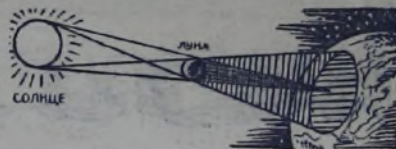
Схема солнечного затмения.

Луна гораздо меньше Земли, её поперечник примерно в 4 раза меньше земного, а объём в 50 раз меньше. По сравнению