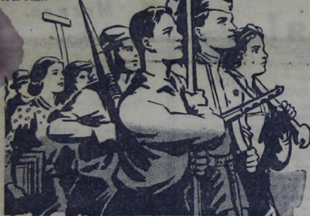
Композиция Л. СМЕХОВА.