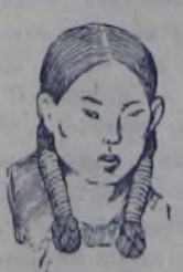
Женщина из племени удэ.