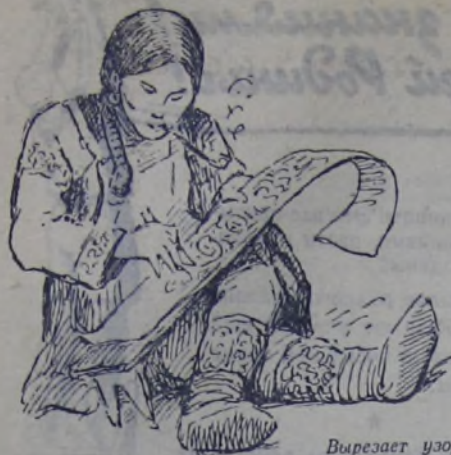
Вырезает узор на березе...

Скорый поезд унесил нашу небольшую экспедицию на Дальний Восток. Перевалив Уральский хребет в средней его части, поезд понёсся по сибирским просторам прямо на Восток — навстречу солнцу. Каждый вечер приходилось переводить московские часы на час вперёд. На десятые сутки, когда поезд подходил к Хабаровску, время ушло на десять часов вперёд. Мы должны были проспать в те часы, когда в Москве только ложились спать.