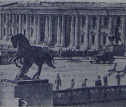
Так вновь выглядит Аничков мост в Ленинграде.

Сейчас бронзовые кони Клодта снова водружены на Аничковом мосту и стоят на тех же местах, на которых стояли сто лет.