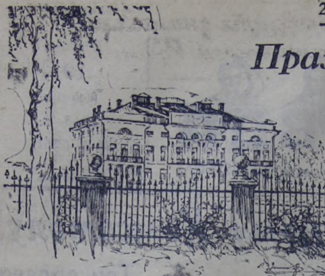
Здание Академии Наук СССР.

16 июня в Большом театре собрались крупнейшие учёные Советского Союза на юбилейную сессию Академии Наук СССР. На праздник советской науки приехали и зарубежные гости — учёные США, Англии, Франции, Польши, Чехословакии, Югославии, Болгарии и других стран. Академии Наук СССР 220 лет! Не только наша страна, но и весь мир отмечает эту славную дату.