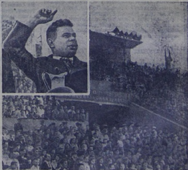
17 июня в Москве на стадионе «Динамо» состоялся общемоосковский митинг молодежи, посвященный награждению Комсомола орденом Ленина. На снимке (слева, сверху): секретарь ЦК ВЛКСМ тов. Н. А. МИХАЙЛОВ выступает на митинге.