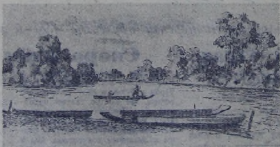
На реке Хор.

Из Хабаровска мы совершили очень интересную экскурсию на реку Хор, которая несётся, крутясь и пенясь, среди непроходимой уссурийской тайги. Мы здесь гостили у племени удэ. Это очень малочисленный народ монгольской расы. На не-