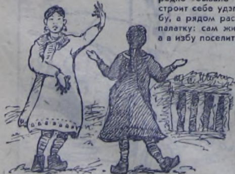
Танец перед клеткой медведя.

затейливую посуду заново вырезают к каждому празднику. Да ещё видели мы, как гилацкие девушки исполняли танец перед клеткой медведя,