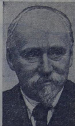
Президент Академии Наук СССР академик В. Л. Комаров.

«Мы помним о прошлом и смотрим в будущее. Впереди большая работа. Я позволю себе выразить уверенность, что в новых условиях мирного процветания советская наука прославит наш народ новыми открытиями, достойными великой Сталинской эпохи».