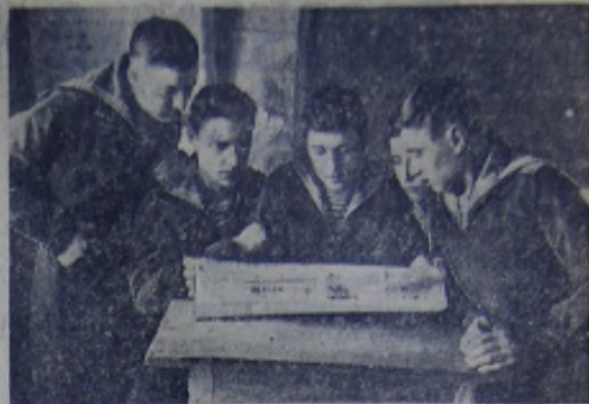
Этот экземпляр прислали нам военные моряки. Несколько лет назад они были деткорами «Пионерской правды», но и сейчас с увлечением читают её.

Просить «Пионерскую правду» довести это решение до сведения пионеров Касторного и всех детей нашей страны».