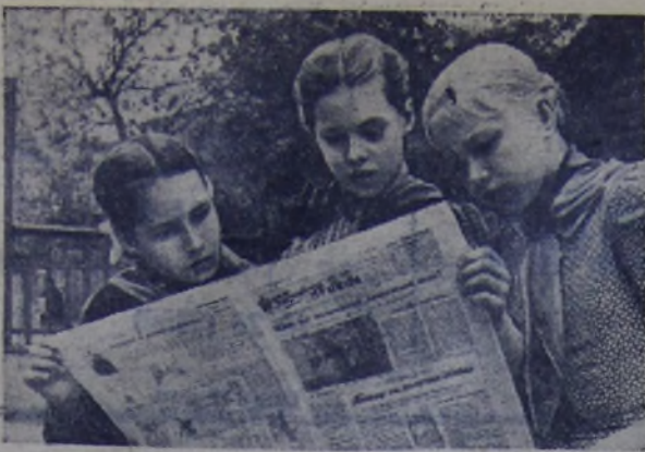
В дружине 174-й московской школы. Получили свежий номер «Пионерской правды».