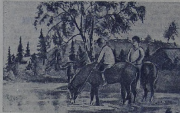
«На водопое». Рисунок школьника Владимира Макеева. (Архангельская область, Верхняя Тойма, деревня Ручьевская).