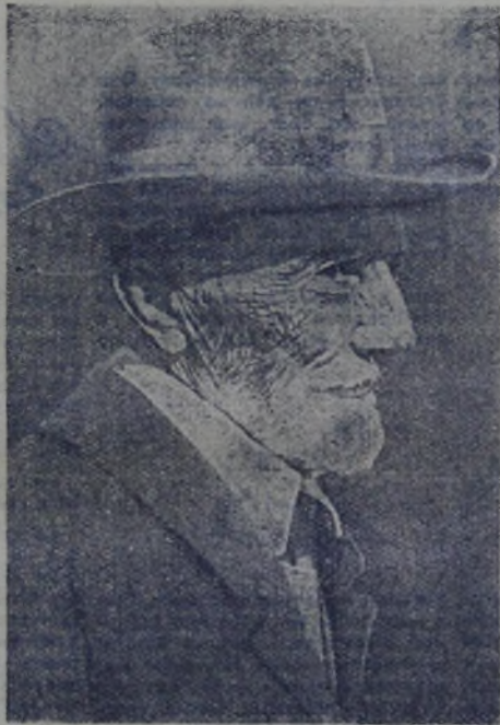
И. В. МИЧУРИН