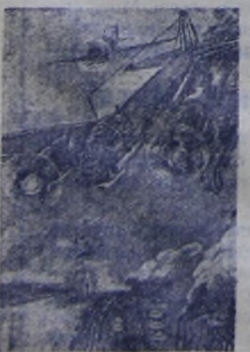
«Фашистский самолёт горит». Рисунок школьника Г. Красте, 14 лет (г. Рига).