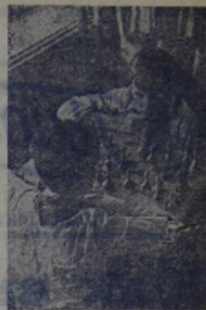
За шахматной доской.