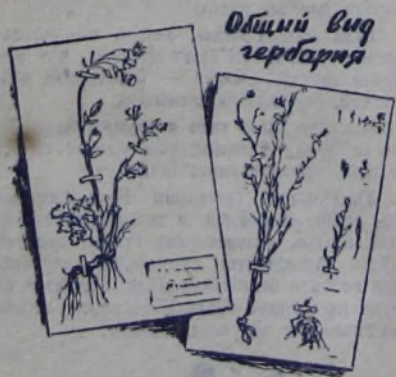
Общий вид гербария

Начальник штаба дружины № 4 ЛЮСЯ КАТЫШЕВА.