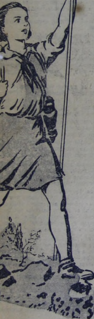
Рис. Л. СМЕХОВА.

женская школа № 71 ой. Пионеры этих школ вечера, различные со- сипа № 1) и девочки от друг другу. ны в полном составе членами штаба 4-й ские каникулы. всё казалось невыпол- гановить какие-нибудь ать такую вещь, как что, можно! И на со- одился большой план тельных лагерях по- этому, подробно рас- ужины Е. Китайгород- т в другие пионеры шитье, ребята! Все за- ноперов будут напеча-