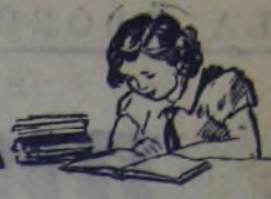
Рис. Вик. КОГОУТА.

Сегодня мы печатаем отрывок из повести Елены Ильиной «Четвёртая высота». Книга эта премирована на конкурсе Детгиза.