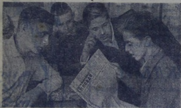
Комсомольцы-старшеклассники 127-й московской школы читают свежий номер «КОМСОМОЛЬСКОЙ ПРАВДЫ».

24 мая советская молодежь отметила славную дату — двадцатилетие своей любимой газеты «Комсомольская правда».