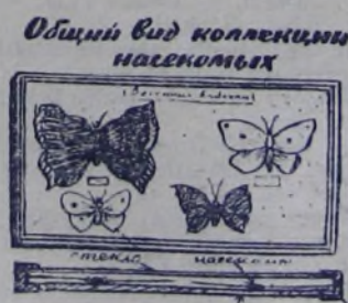
Общий вид коллекции насекомых