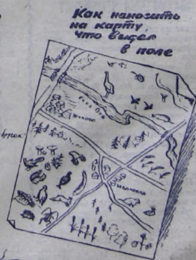
Как наносить на карту то, что выделено в поле