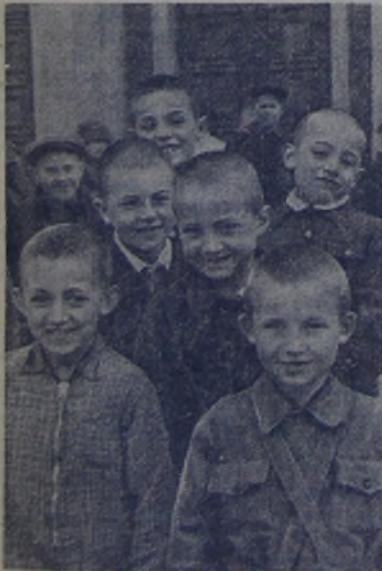
Ученики 429-й московской школы, перешедшие во второй класс. Они уже закончили свой первый учебный год. Многочисленным мальчишкам в школе. Теперь они могут читать книги, писать письма родным и друзьям, решать задачи. Впереди весёлые каникулы, первые школьные каникулы в их жизни.