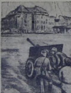
Уличные бои в Бреслау. Орудие сержанта С. И. Голубя на огневом рубеже.

В Венгрии, северо-восточнее и восточнее озера Балатон, наши войска отбивали атаки крупных сил танков и пехоты противника. Пленные немцы показывают, что они имеют приказ любой ценой выйти к Дунаю. Советские пехотинцы, артиллеристы и бронейщики мужественно отражают вражеские атаки.