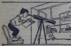
Рис. Ю. УЗБИКОВА.

— Ну, теперь уж я приду в школу с решённой задачей!..