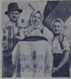
В Чехословакии. Радостно встретили Красную Армию жители села Нижне-Скальник. Семья Ситарчик вышла навстречу бойцам с хлебом-солью.

Войска 2-го Белорусского фронта, после двухнедельной осады и упорных боёв, разгромили окружённую группировку противника и овладели городом и крепостью ГРУДЗЯНЗ (ГРАУДЕНЦ). Взято в плен более 5.000 солдат и офицеров противника вместе с командантом крепости генерал-майором Фрикке и его штабом.