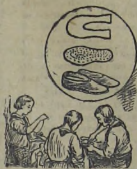
Девочки умеют многое мастерить...