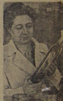
Профессор З. В. Ермолева, лауреат Сталинской премии, создавшая новый лечебный препарат — «пенициллин». Этот препарат спас жизнь многим раненым бойцам Красной Армии