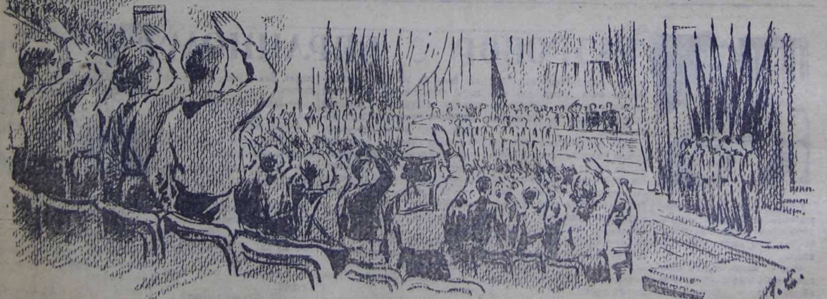
Закрытие слёта. Делегаты полка Гимназии Советского Союза.

Слёт окончен. Подведён итог годовой работы 180-тысячной армии юных ленинцев Москвы. Много сделано и много ещё впереди славных пионерских дел, совершаемых ежедневно, ежечасно вашими советскими ребятами на благо дорогой отчизны.