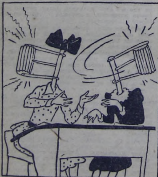
Нет ли таких в вашем классе?