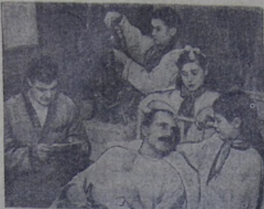
Писатели 424-й московской школы в подшефном госпитале. У постели раненого гвардейца.