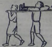
Эту забавную шутку можно легко подготовить к вечеру-самодельности.