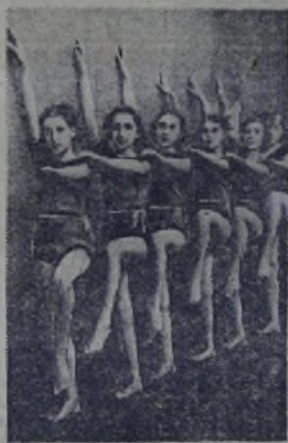
Пионерки 587-й московской школы учатся художественной гимнастике в Центральной Детской спортивной школе. На снимке: групповое упражнение у стенки.