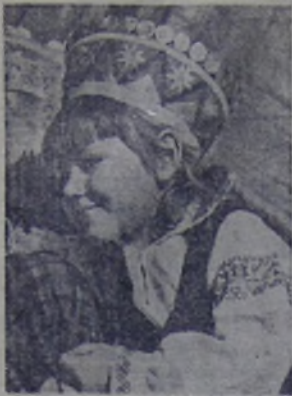
— Красная Армия прогнала немцев, хорошо теперь живём! — написано на лице у этой маленькой латышки, одетой в национальный костюм своей республики.