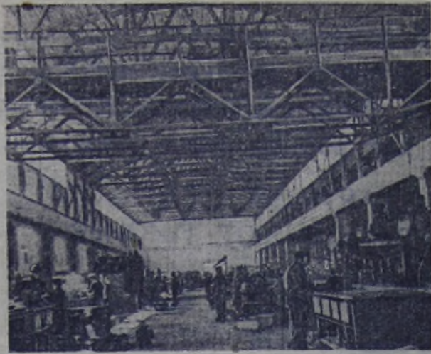
Один из восстановленных цехов Сталинградского ордена Лейпциг и Трудового Красного Знамени тракторного завода.