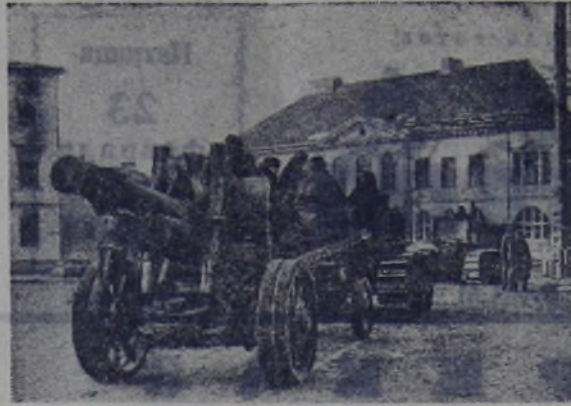
Действующая армия. Советские войска движутся к линии фронта.