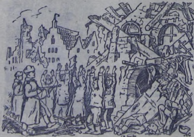
Часть Красной Армии заняла немецкий город. Фашистские солдаты подняли руки. Её их командир спрятался. Где он?