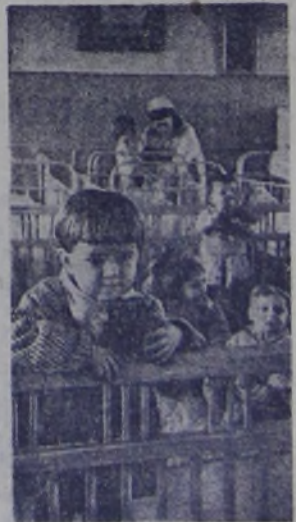
Детские ясли № 202 в Ленинграде были разрушены немецким снарядами. Теперь они снова восстановлены, и снова в яслях зазвучали голоса и смех малышей — детей фронтовиков.

Молодёжь Минской области организовала специальные красные обеды с хлебом, овощами и другим продовольствием для детей воинов. Многие комсомольцы Дзержинского и Червеньского районов взяли на воспитание сирот.