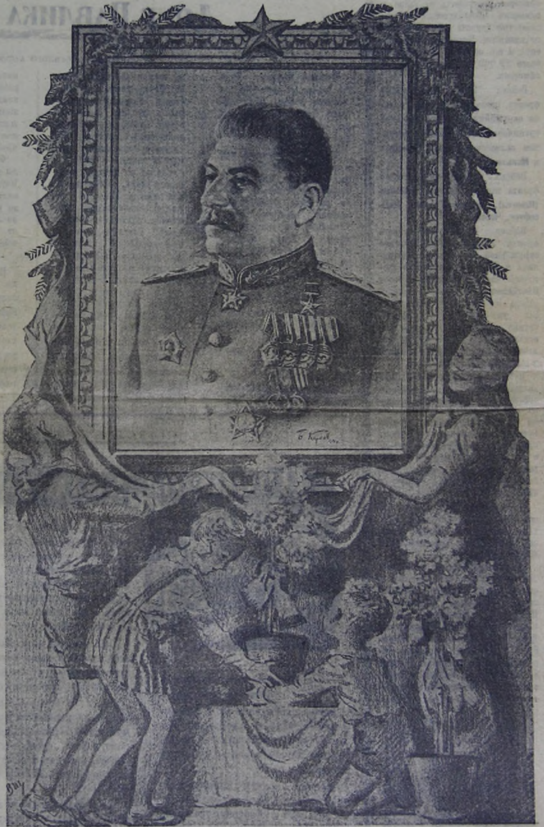
Композиция В. ПЕГЛОВА.

Полная победа над немцами теперь уже близка. Но победа никогда не приходит сама, — она добывается в тяжелых боях и в упорном труде. Обреченный враг бросает в бой последние силы, отчаянно сопротивляется, чтобы избежать сурового возмездия. Он хватается и будет хвататься за самые крайние и подлые средства борьбы. Поэтому надо помнить, что чем ближе наша победа, тем выше должны быть наша бдительность, тем сильнее должны быть наши удары по врагу.