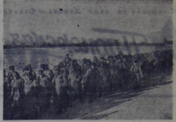
Первый Белорусский фронт. Колонна пленных гитлеровцев.