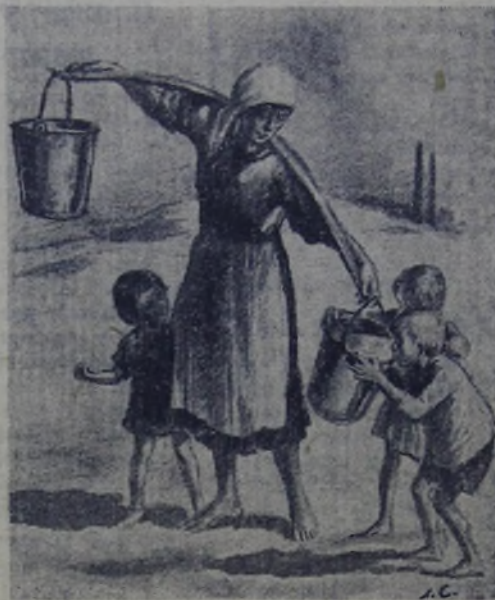
Рис. Л. СМЕХОВА.

Ещё дальше ей встретилась женщина с тремя детьми, из которых самого маленького, вконец измученного зноем, она несла на руках, другого, едва переставлявшего босые ножки, тащила за руку, а третий, немного