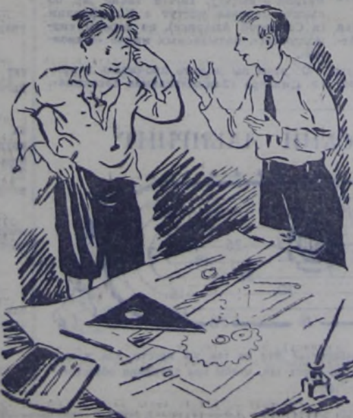
Рис. Пин. КОГОУТА.

— Ты что делаешь? — Изобретаю машину для пришивания пуговиц.