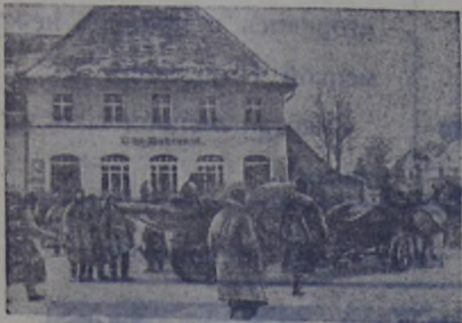
На подступах к Кенигсбергу. Наши войска проходят через немецкий населенный пункт. Все дальше и дальше движутся части Красной Армии, сметая со своего пути вражеские укрепления.