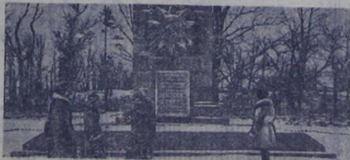
Этот обелиск построен под Ленинградом в районе Стрельны. На нём написано: «Здесь в жестоких сентябрьских боях 1941 года захлебнулись собственной кровью фашистские полчища, остающиеся доблестными ленинградцами».