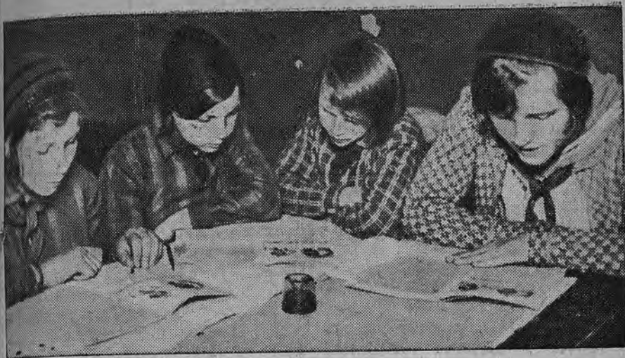
Коллективная проработка материалов к 10-летию пионерорганизации по журналу «Вожатый» № 8.

бы этот учебный год закончить с наименьшими недочетами и с наибольшими результатами по выполнению постановления ЦК партии о школе.