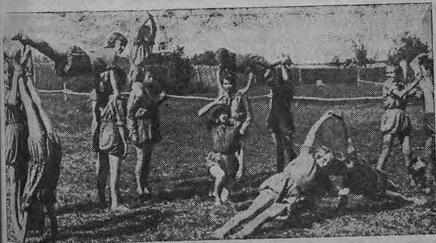
Физкультурные упражнения (ст. Момино, Моск. обл.).

Достигнуть того, чтобы культурные силы страны повели особую работу по культурному обслуживанию детей, потребовать от общественных организаций расширения условий для работы с детьми по их культурному обслуживанию, расширения сети детских кино, театров, клубов, домов художественного воспитания — все это должно найти свое прямое отражение в руководстве комсомола культурно-массовой работой детей. Такие элементы художественного воспитания детей, как музыка, пение и пр., в большинстве организаций пионеров находятся в загоне. Они часто недооцениваются комсомолом и руководством деткомдвижения как формы воспитания культурного поколения. А между тем тяготение к этим областям со стороны детворы все повышается. Организовать это стремление, помочь школам и отрядам в по-