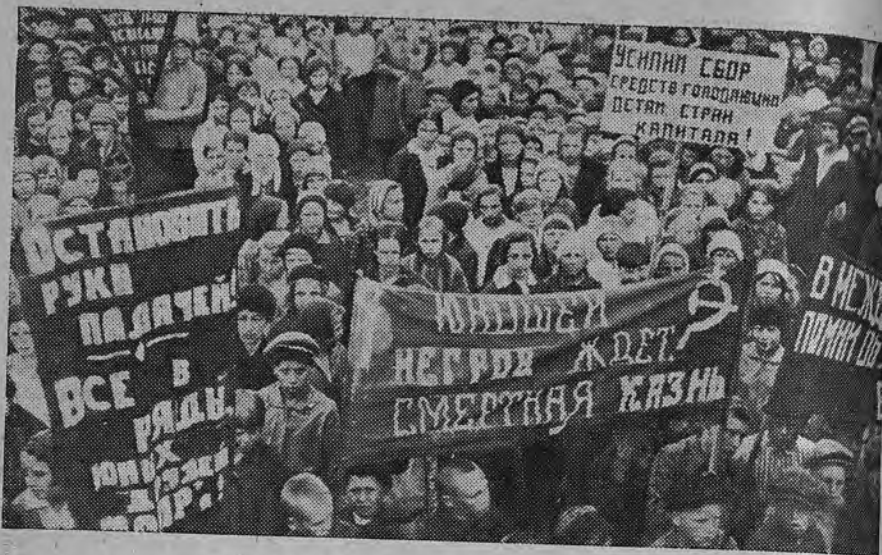
Пионеры и школьники протестуют против казни семи негритянских узни ов (г. Кимры)

хозяйственной, профсоюзной и советской работе.