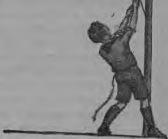
Листовки, распространяемые французскими пионерами к отчету своей делегации по приезде из СССР.