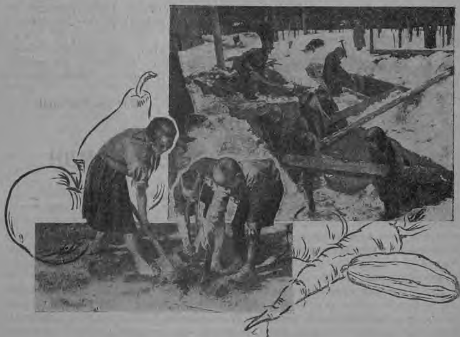
Началась забота о пионерском огороде.

Результаты Опыт был первым, поэтому обошлось не без шероховатостей. Были случаи неполного посещения ребят, слабо был поставлен учет, но в общем результаты сказались. На осенней выставке многие ребята и звенья получили премии. Получила премию и школа. Своими результатами оказались довольны как ребята, так и их отцы.