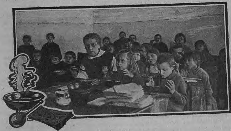
В большую перемену

Техника питания Техника организации горячих завтраков обсуждалась хозяйственными артелями. Посуду каждый должен был принести свою, и для того, чтобы ее не перепутать, перенумеровать эмалевой краской. Так как специального помещения для столовой не имелось, то ели