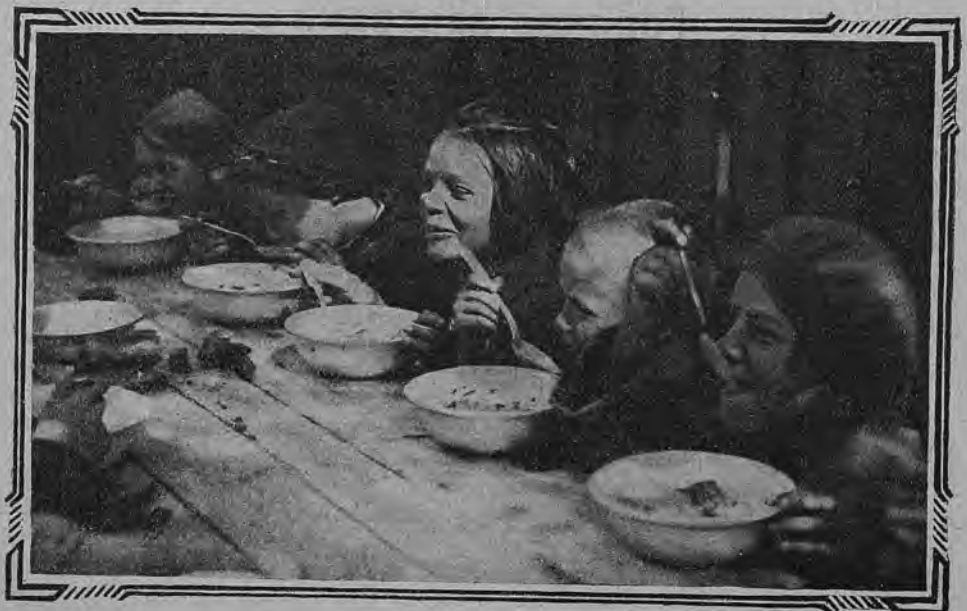
На сытый желудок лучше заниматься

Родительское собрание оказалось на редкость многолюдным. Заведующий школой сделал доклад о нагрузке детей в школе, о состоянии здоровья детей, о плохой усвояемости учебного материала на последних уроках, о необходимости организации детского питания в школе. Врач рассказал о значении горячего питания для детского организма.