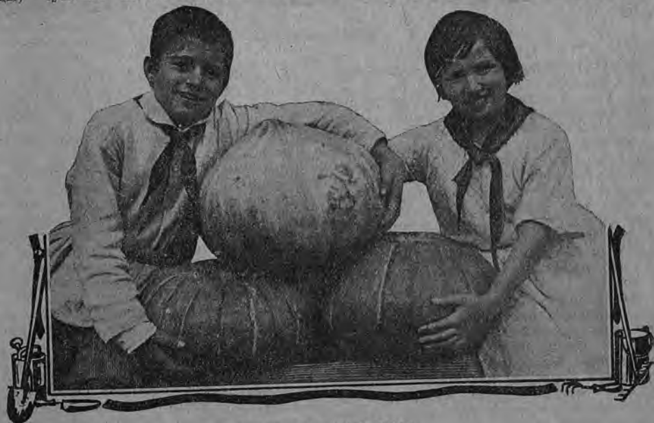
Фрукты пионерского труда

По Сычевскому уезду имеется 4 специально пионерских огорода, школьно-пионерских — 19 (всего деревенских отрядов 36). Огороды засеяны, главным образом, корнеплодами и овощами: огурцами, капустой, морковью. Зиловский отряд, Сычевск. у., посеял 30 кв. саж. огурцов, мор-