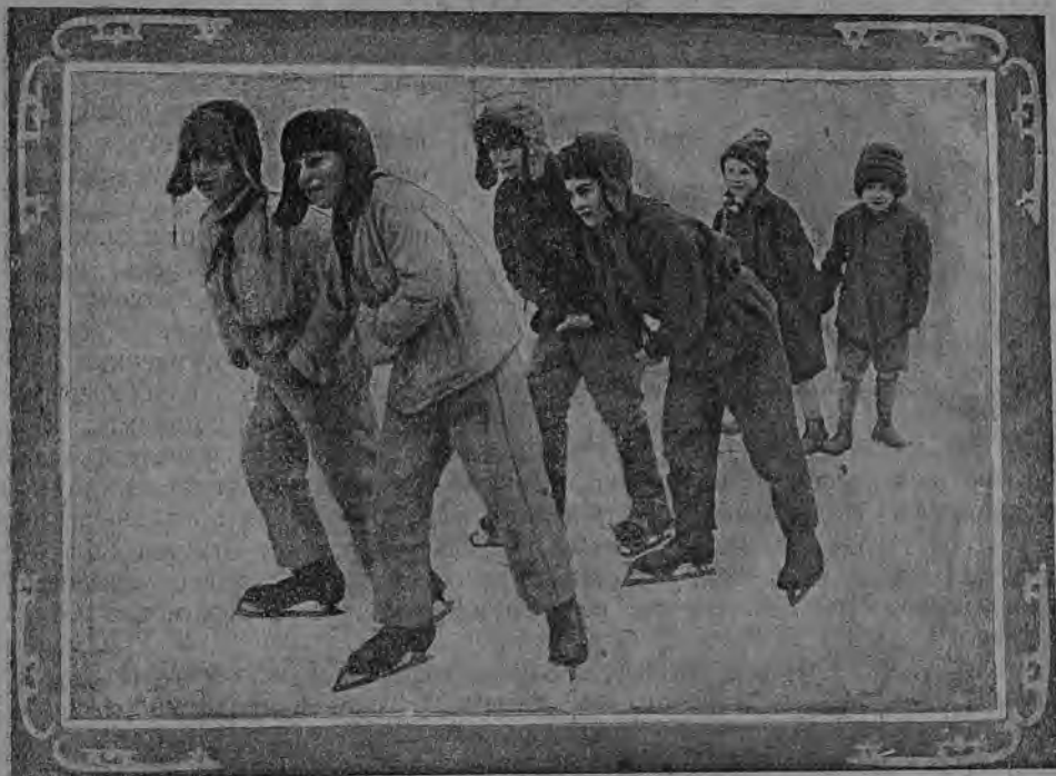
Любимое зимнее занятие

Больше движений! В нынешнем учебном году Наркомпрос в число школьных обязательных занятий включил физическую культуру. Пионерам нужно принять все меры к тому, чтобы это осуществлялось на деле, но это не исключает необходимости занятий физкультурой в отряде. Нужно познакомиться со школьными программами и на отрядных занятиях не делать нудных повторений, но здесь зато большая возможность организации интересного досуга ребят, насыщенного движениями. Нужно дать больше движений под песню, декламацию, для чего можно использовать «Ритмические игры и упражнения, проводимые под пение»—Двоскина