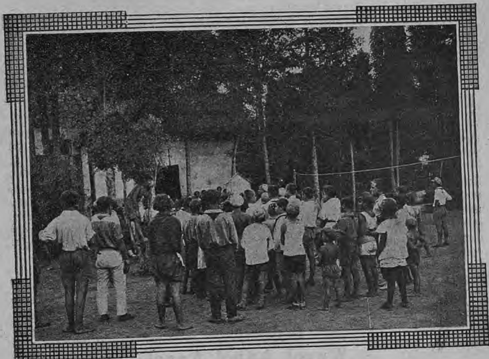
Алло, алло, алло! Говорит вещательная станция