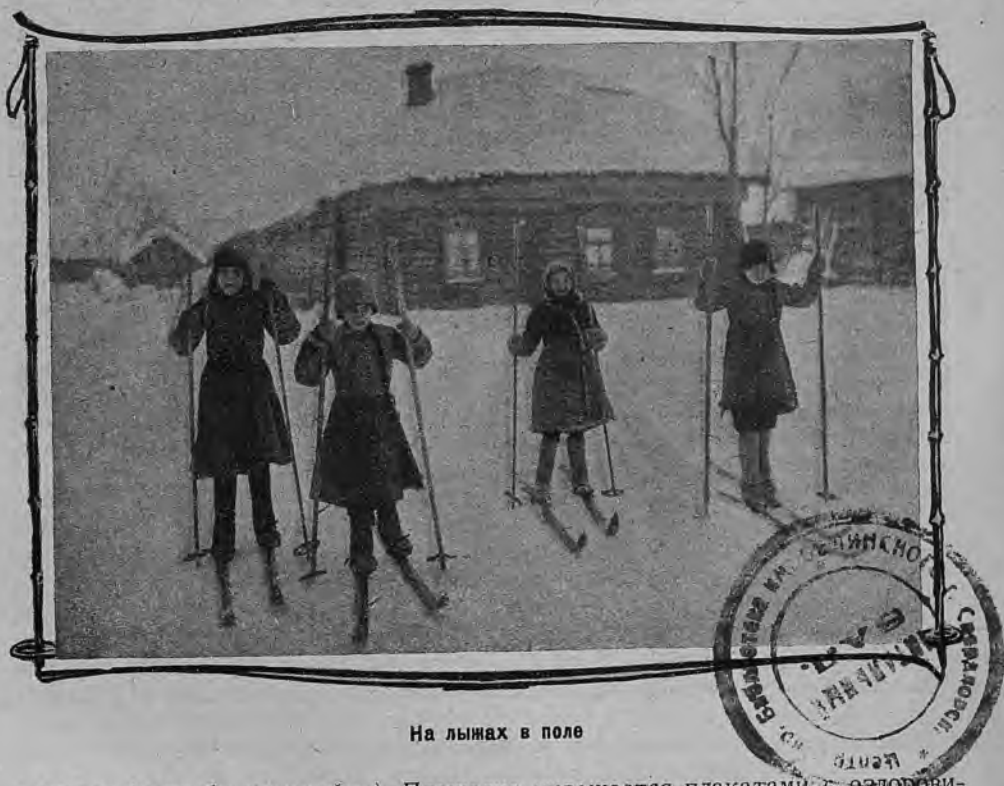
На лыжах в поле

На такой даже простой площадке можно с большим успехом проводить праздники. Особенно интересны бывают праздники, проводимые под