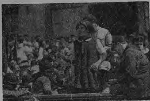
Привет русским детям от детей рабочих Англии.