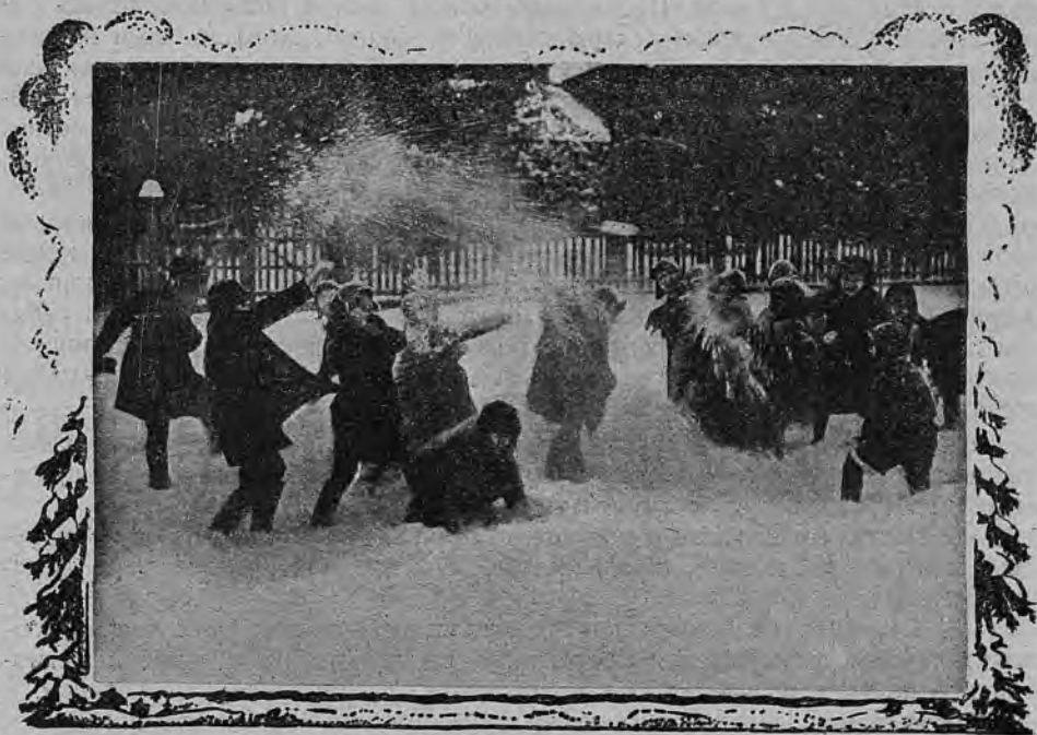
Выпал первый снег...

Для тех отрядов, которые не могут воспользоваться даже указанными материалами, площадка может работать примерно так. В первую очередь