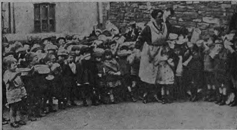
Раздача обедов детям горняков (во время забастовки)

16 мая — понедельник. День интернациональной связи. Посылка писем в пионер-отряды, школы и детдома СССР. Переписка с пионерами соседних