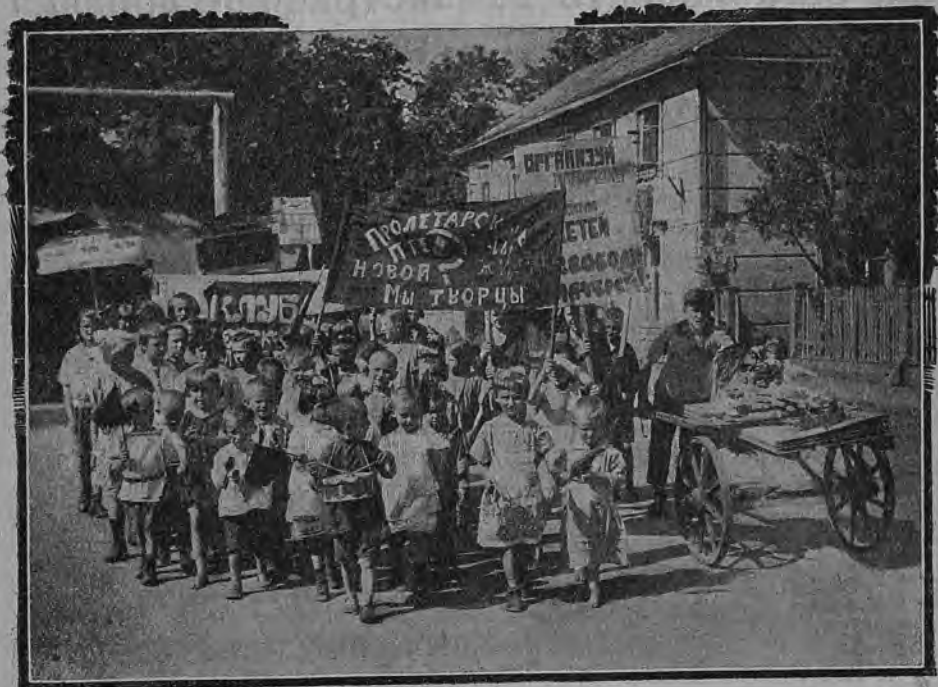
На свежий воздух!

Праздник может начаться с различных состязаний по физкультуре — в беге, плавании, гребле, баскетболе, прыжках и т. п.