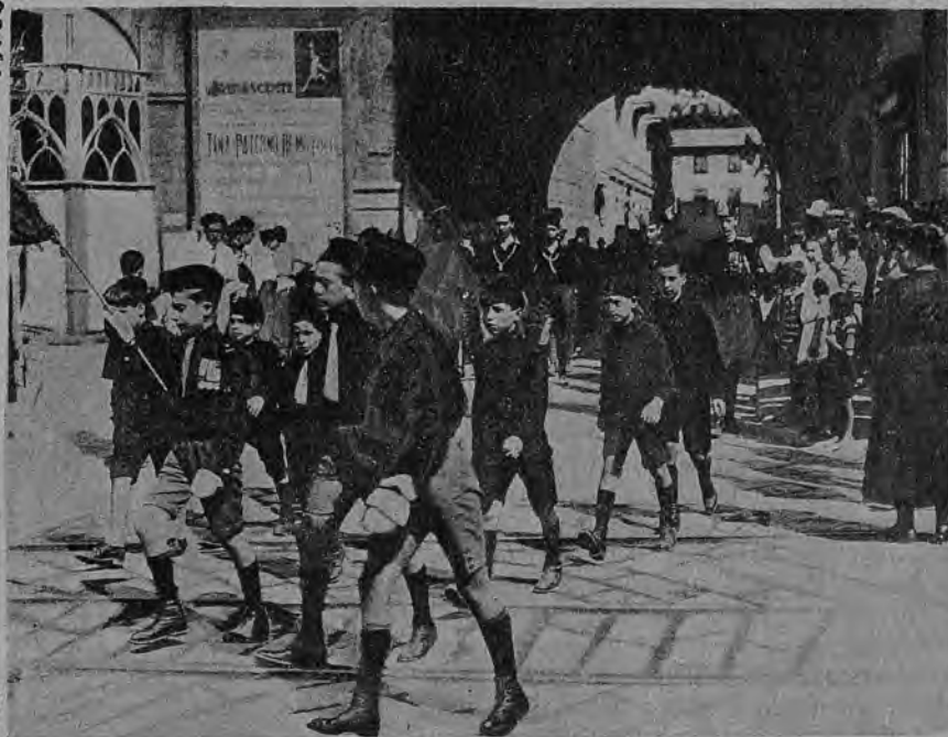
Юные фашисты (Италия)

Вторая группа—это с.д. и всякого рода рабочие организации, которые находятся под руководством правого крыла рабочего движения.