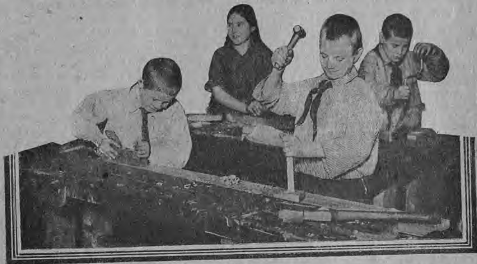
«Нравится строгать и рубить»

«Скажи мне, что ты читаешь, и я скажу, кто ты» Так любят говорить библиотекари, так хотели сказать и мы. Картина получилась довольно печальная — с чтением дело обстоит плохо. Из периодической литературы читают: свою краевую детскую газету «Юный Ленинец» — 17 человек, «Пионерскую Правду» — 9 чел., местную партийную газету «Красный Алтай» — 11 человек, журнал «Пионер» — трое, «Мурзилку» —