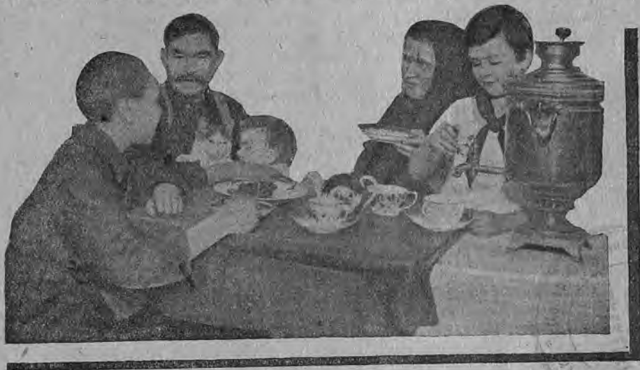
Дома за чаем

Помимо перечисленных возможностей работы с родителями, пионеротряд может проделать еще очень и очень многое, например: привлечение родителей к отрядной работе, вовлечение работниц в клуб в кружки кройки