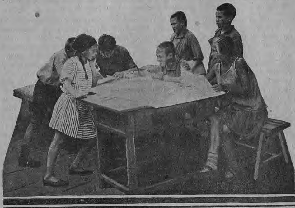
Звено за чертежами

ставка пропустила около 800 экскурсантов—школьников и пионеров. С ребятами проводились короткие беседы о принципах построения той или иной модели; после объяснений устраивался обмен мнениями о том, какая модель является самой лучшей. Каждому экскурсанту предлагали положить билетик к модели, более всего ему понравившейся. «Премировались» больше всего