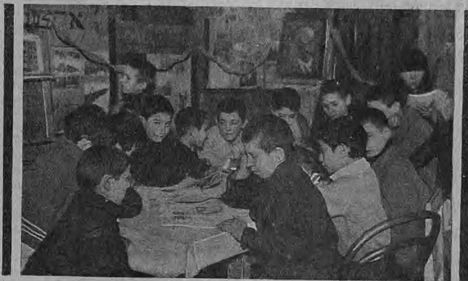
Октябрята в читальне

Предполагается развернуть еще две формы работы для помощи непосредственной работе группы: консультация — в тех случаях, когда группа не прикреплена к ЦД, но нуждается во временной помощи (напр., не могут у себя сделать салазок или коньков — могут прийти в ЦД и сделать это там); вторая форма — организация передвижного театра. Предполагали организовать кукольный театр, но пока не осуществили этого;