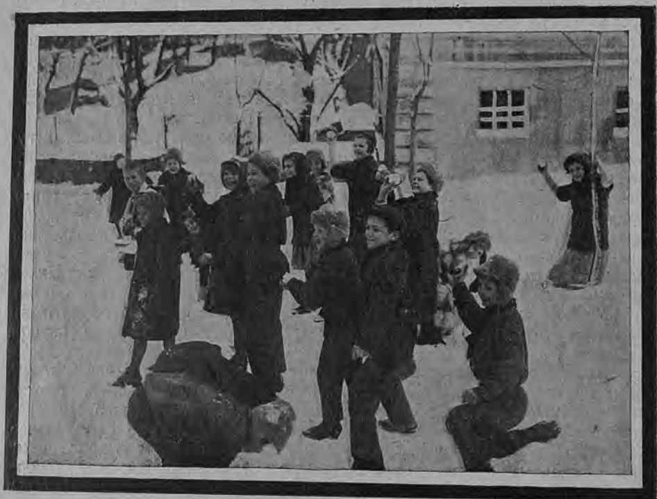
В с н е ж н и!

Особенно полезно открывать окна или форточки по утрам и перед сном, а также в перерывах между занятиями; совершенно необходимо физические упражнения проводить при открытых окнах или форточках, а там, где это возможно, и на открытом воздухе. Все свободное время пионеру следует по возможности проводить на воздухе, соединяя это пребывание с движениями (прогулкой) или игрой. Не меньшее внимание пионер должен уделить борьбе с пылью. Уборку помещений нужно проводить не сухим, а влажным способом: обмотать швабру мокрой тряпкой или посыпать пол мокрыми опилками и только тогда подметать; пыль с предметов надо стирать мокрой тряпкой. Один раз в неделю необходимо мыть полы в помещении. Необходимо позаботиться о том, чтобы пыль с одежды, обуви не вносилась в помещение, где мы спим, работаем, отдыхаем. Для этого нужно устроить вешалку