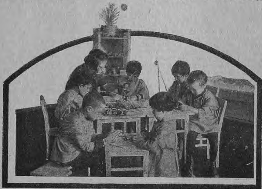
В комнате малышей

На совете отряда надо прочесть и обсудить это письмо. После этого нужно поручить старшему звену выяснить, есть ли поблизости ЖАКТ'ы (желательно общежитие рабочих), какой из них более населен и где нужнее всего повести работу. Если обнаружится, что работа в ближайшем ЖАКТ'е нужна и может быть проведена вашим отрядом, совет отряда поручает: