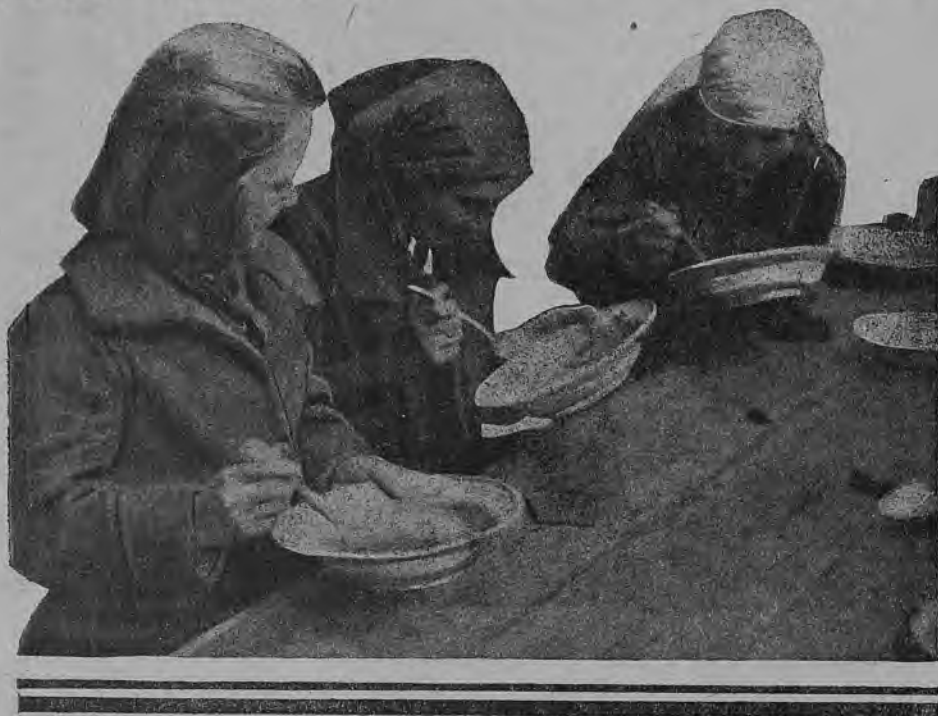
Дешево, вкусно, полезно

Теперь я кратко остановлюсь на тех условиях, при которых мы работаем и имеем завтраки. Здание нашей школы очень перегружено и не имеет ни одной свободной комнаты для столовой, которую, на 70—80 человек, в силу необходимости мы устроили в единственной небольшой комнате, служившей местом отдыха и работы учителей, для чего пришлось перевести учительскую в тесную библиотеку.