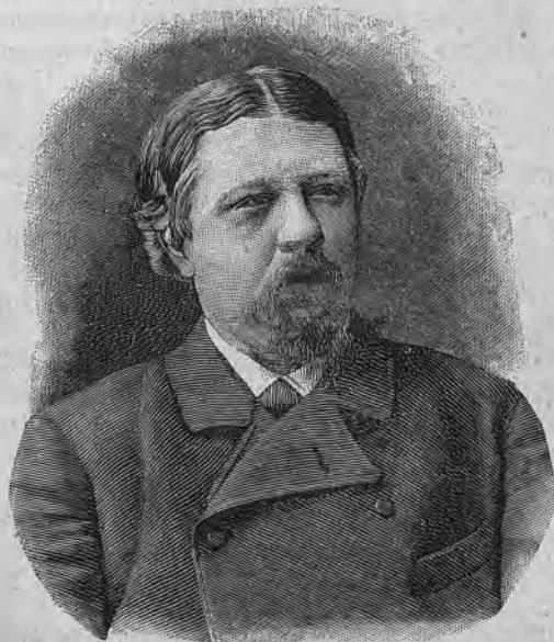
С. Н. Терпигоревъ.