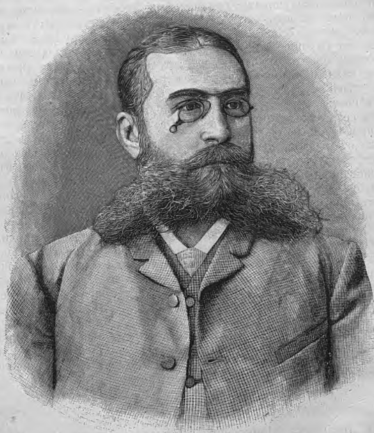
В. И. Немировичъ-Данченко.

оставался тамъ до конца военныхъ дѣйствій, принявши участіе въ дѣлахъ при Парапанѣ, въ бомбардированіи Журжева, въ переходѣ черезъ Дунай у Зимницы, въ дѣлахъ 9-го, 10-го и 11-го августа на Шипкѣ, 30-го августа подъ Плевной, 12-го октября подъ Кадыкіюемъ, въ дѣлахъ на Зеленыхъ горахъ въ отрядѣ Скобелева, въ зимнемъ переходѣ черезъ Балканы, въ сраженіи подъ Шипкою 28-го декабря, въ занятіи Адрианополя