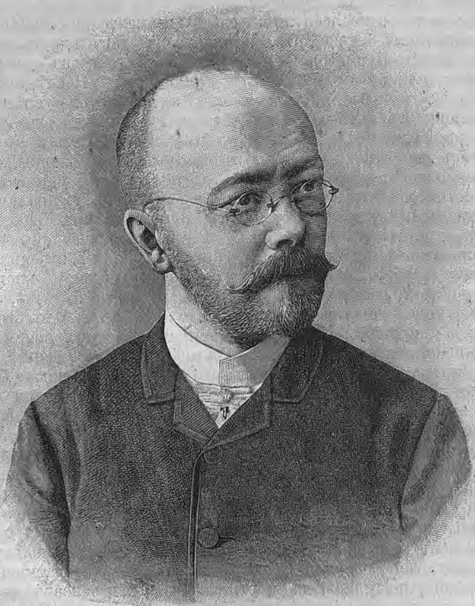
П. Д. Боборыкинъ.

Самымъ талантливымъ и плодовитымъ беллетристомъ этого лагеря является Петръ Дмитриевичъ Боборыкинъ. Онъ родился въ Нижнемъ-Новгородѣ 15-го августа 1836 года въ богатой дворянской семьѣ и, живя при матери въ домѣ дѣда, получилъ вполне дворянское воспитаніе, т. е. съ дѣтскихъ лѣтъ зналъ уже иностранные языки и упражнялся въ музыкѣ. Поступивъ въ Нижегородскую гимназію, при блестящихъ способностяхъ онъ