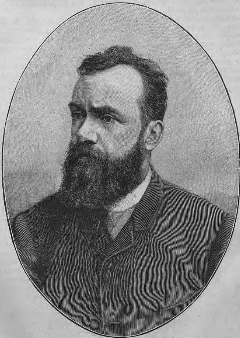
Г. И. Успенскій.

щемъ отъ особенностей ихъ талантовъ, различными путями пришли къ одной и той же цѣли. Въ то время, какъ Гл. Успенскій своимъ разлагающимъ, чисто прудоновскимъ анализомъ, вооруженнымъ беспощаднымъ