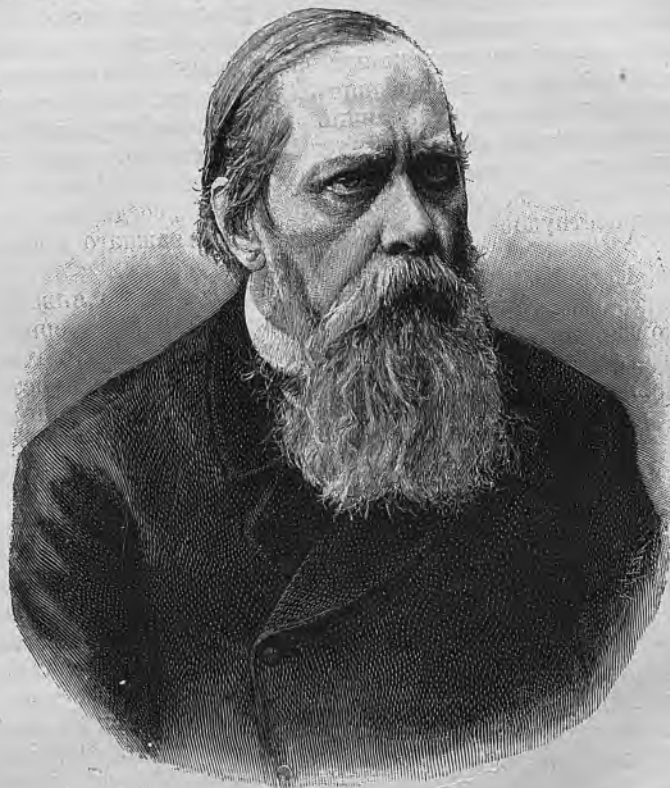
М. Е. Салтыковъ.

Судя по всему, порядки въ лицей въ то время были очень строгіе, и начальство употребляло все усилія, чтобы вывѣтрить изъ лица традиціонный духъ Куницына и Пушкина. Но бороться съ этимъ духомъ было чрезвычайно трудно, особенно въ виду свѣжей еще могилы Пушкина, умершаго всего годъ назадъ такой трагической и обаятельной для юношества смертью. Какъ ни преслѣдовало начальство стихотворство,