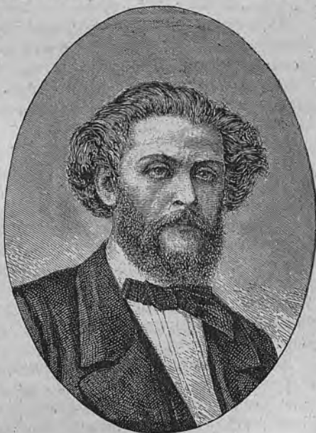
Н. Г. Помяловскій.

Но дни его были сочтены. Удивительно, какъ онъ могъ обнаружить такую энергическую дѣятельность среди почти безпробуднаго запоя. Надо замѣтить при этомъ, что пьянство его носило мрачный характеръ. Вино нисколько не веселило его и не разсѣвало гнетущей тоски, которою былъ преисполненъ этотъ надломленный и ожесточенный человекъ. «Желчными, глубоко рвущими сердце страданіями,—по словамъ біографа его, Н. А. Благовѣщенскаго,—выражалось его опьяненіе, такъ что, глядя