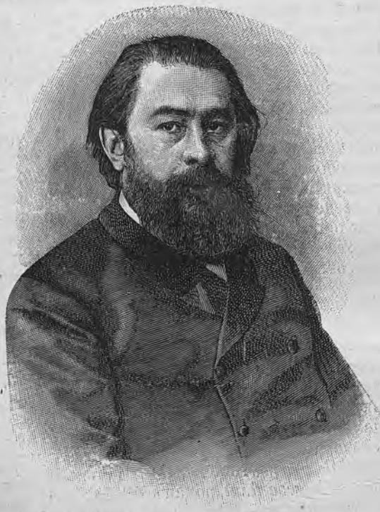
Н. А. Лейкинъ.