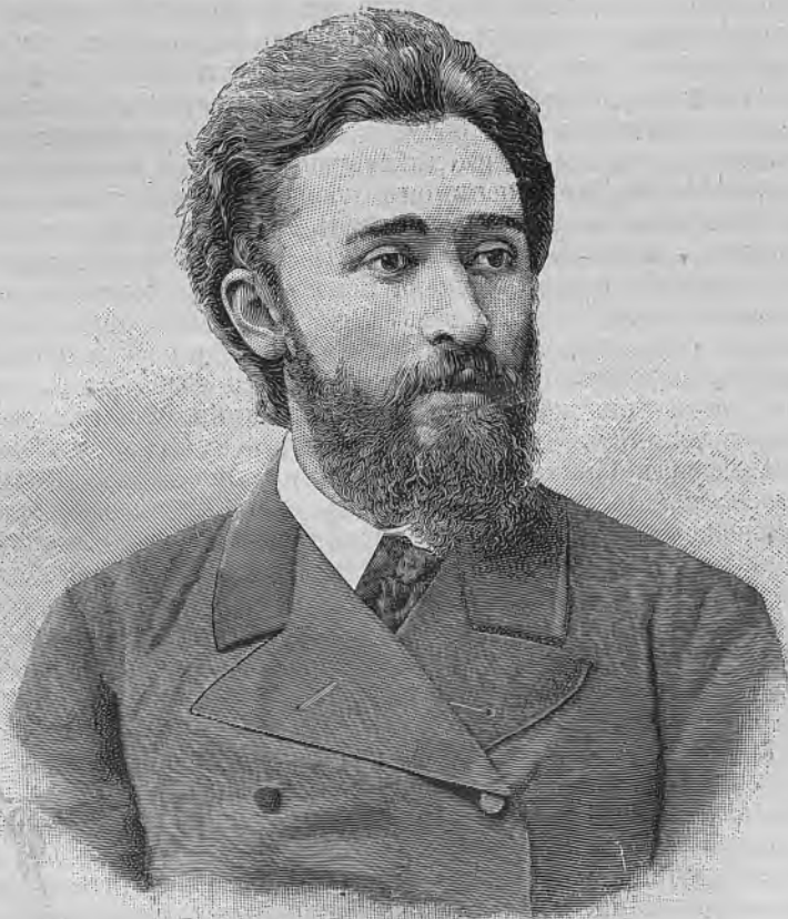
В. М. Гаршинъ.

Въ концѣ 1872 года, когда Гаршинъ былъ въ седьмомъ классѣ, его впервые посѣтилъ душевный недугъ, сведшій его впоследствіи въ могилу. Родные должны были помѣстить его въ больницу св. Николая. Но мало-по-малу здоровье его оправилось. Помѣщенный въ лечебницу д-ра Фрея лѣтомъ 1873 года, онъ окончательно выздоровѣлъ.