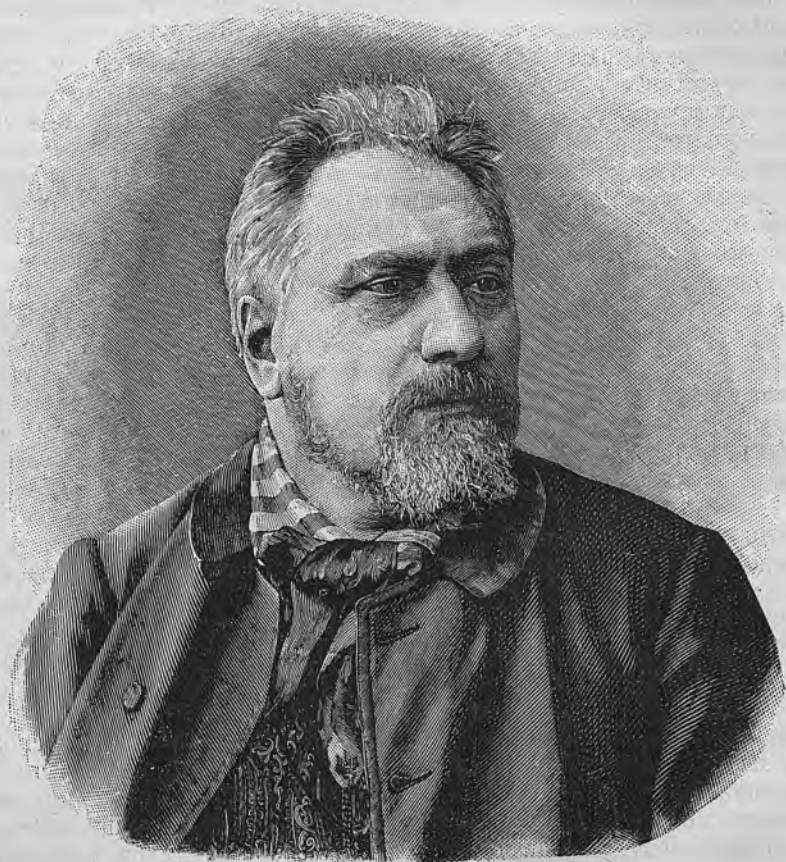
Н. С. ЛѢсковъ.