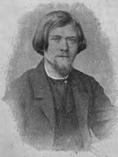
А. И. Левитовъ.

Александръ Ивановичъ Левитовъ былъ родомъ тамбовецъ. Отецъ его былъ бѣдный сельскій священникъ. Родился Левитовъ въ 1842 году, и