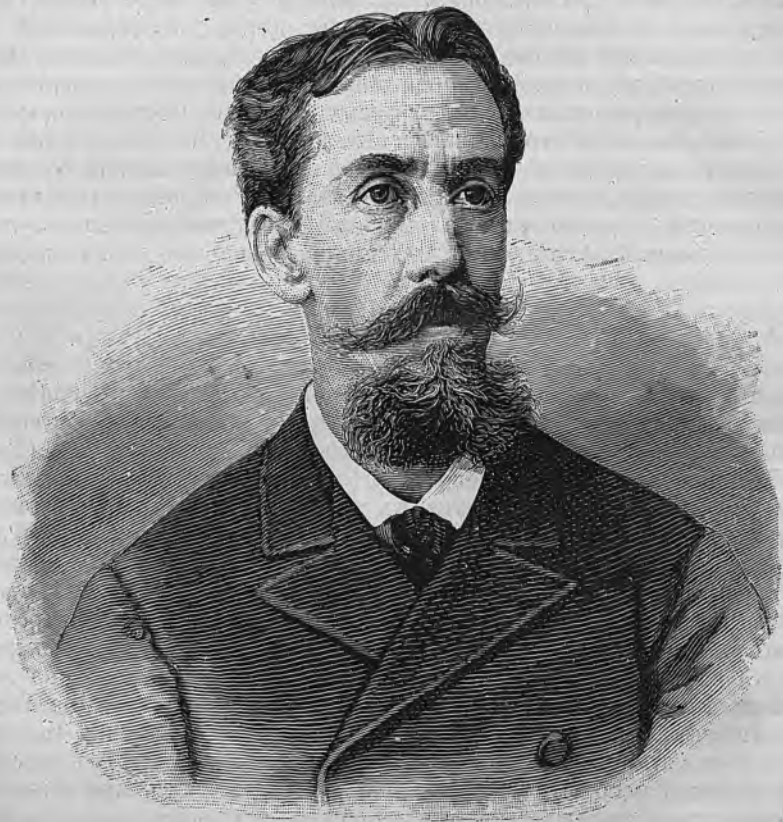
Е. А. Салиасъ.

тина казанскаго общества предъ возстаніемъ, броженіе въ народъ и начало смуты, взятіе Казани, портреты Бибикова, Рейнсдорпа, Суворова, Фреймана. Но въ цѣломъ романъ представляетъ существенные недостатки. Гр. Салиасъ не могъ избѣгнуть подчиненія вліянію гр. Л. Толстого, и оно сказывается во многихъ типахъ и сценахъ романа. Напримеръ, въ pendant пари Долохова съ англичаниномъ, у Салиаса Ахлатскій бьется объ закладъ съ Туровскимъ, что взвѣдетъ на конѣ по лѣсамъ строящейся колокольни до самаго креста. Въ pendant описанію Л. Тол-