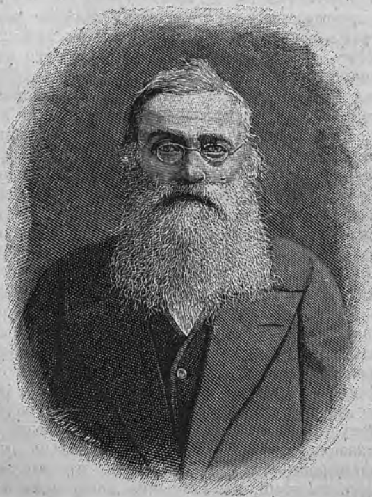
Н. И. Костомаровъ.

Изученіе бунта Стеньки Разина привело Костомарова къ созданію повѣсти Сынъ , рисующей нравы и бытъ русскаго общества въ XVII вѣкѣ,