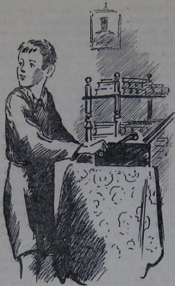
Он обернулся нечаянно к двери.