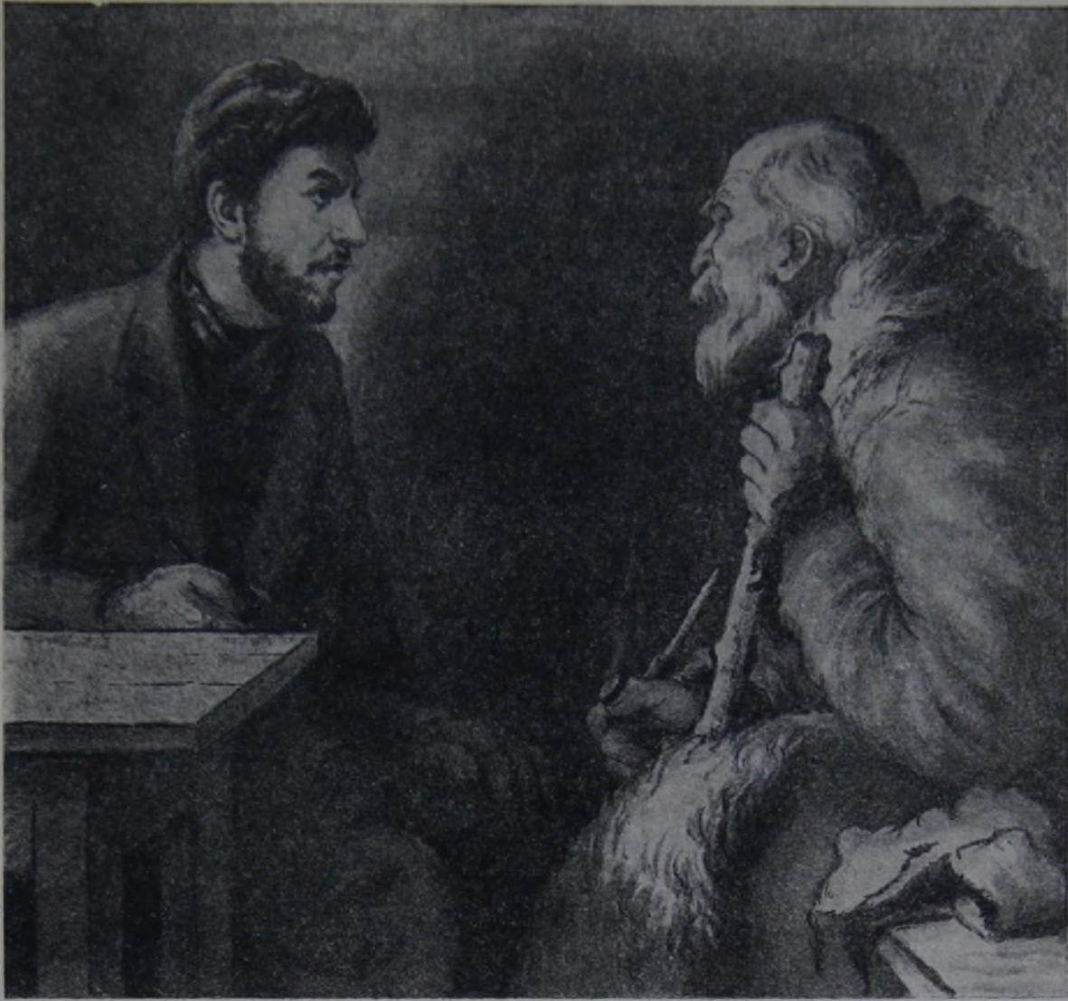
Сталин в ссылке.