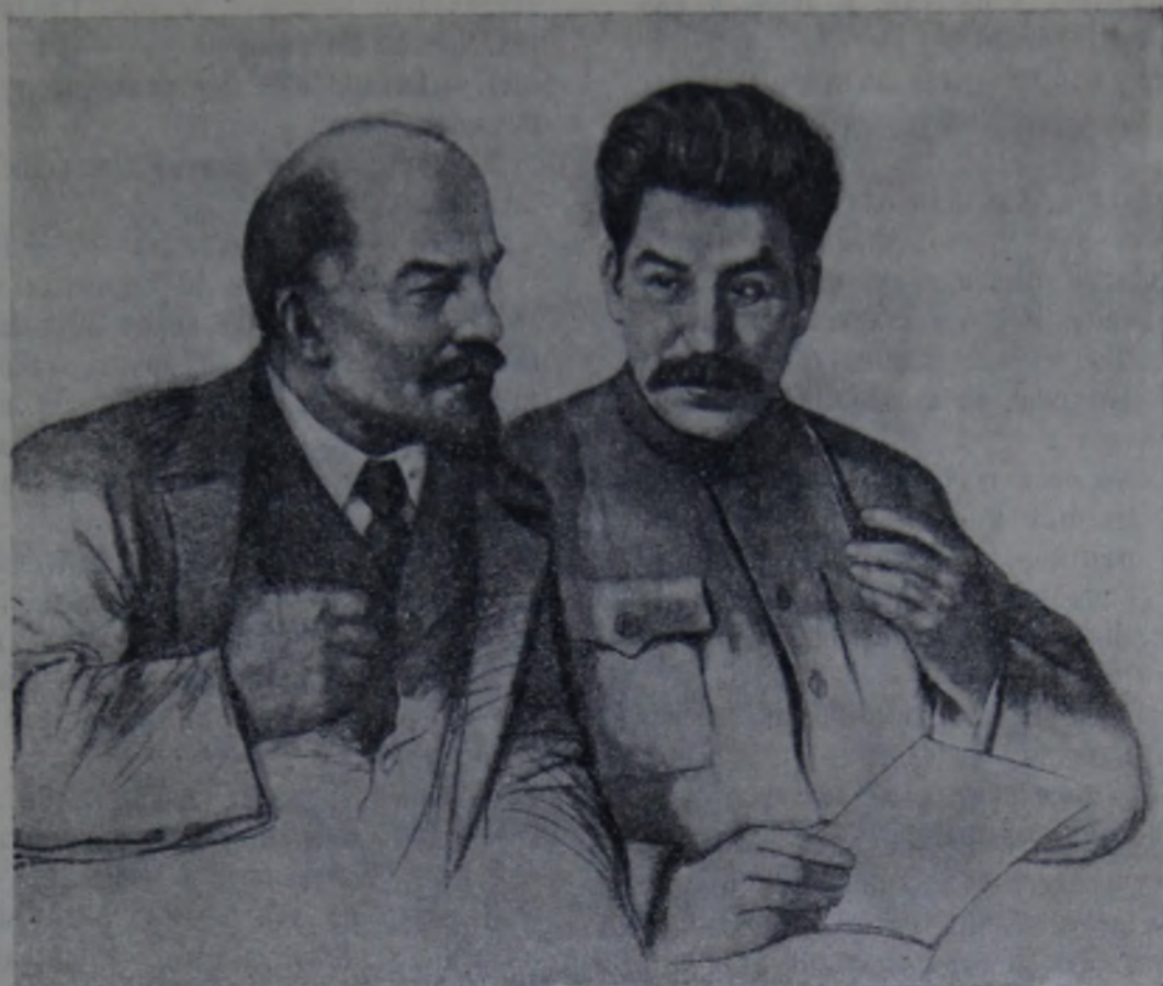
Ленин и Сталин.