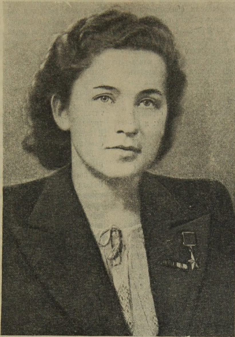
Герой Советского Союза Надежда Троян.