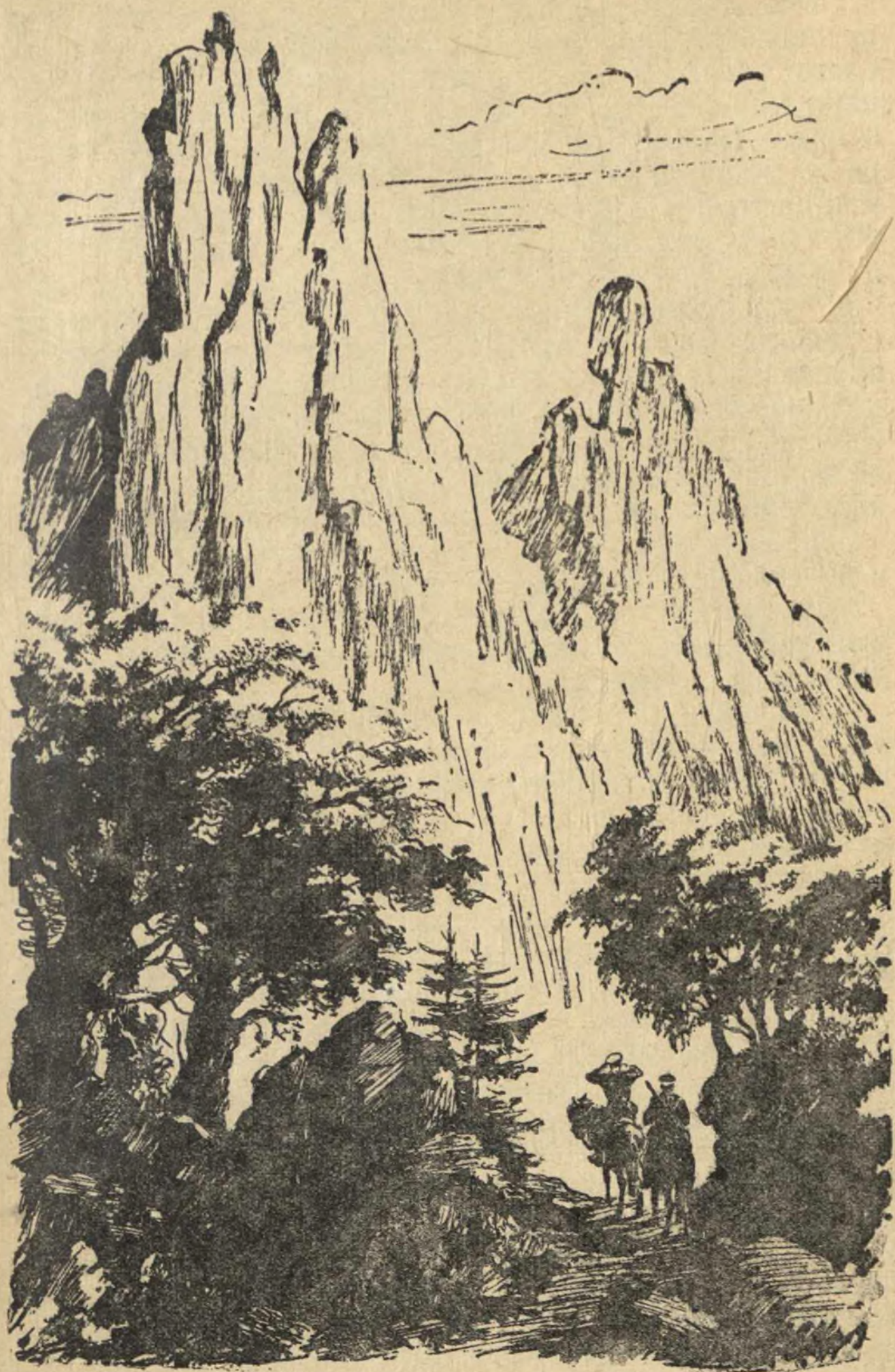
В Уссурийских лесах.