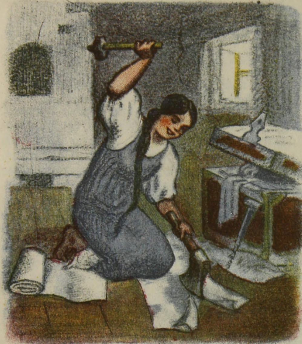
Рис. худ. Н. ХОДАТАЕВА

В речку опускала — Речку осушала, Из речки тащила — Берег своротила.