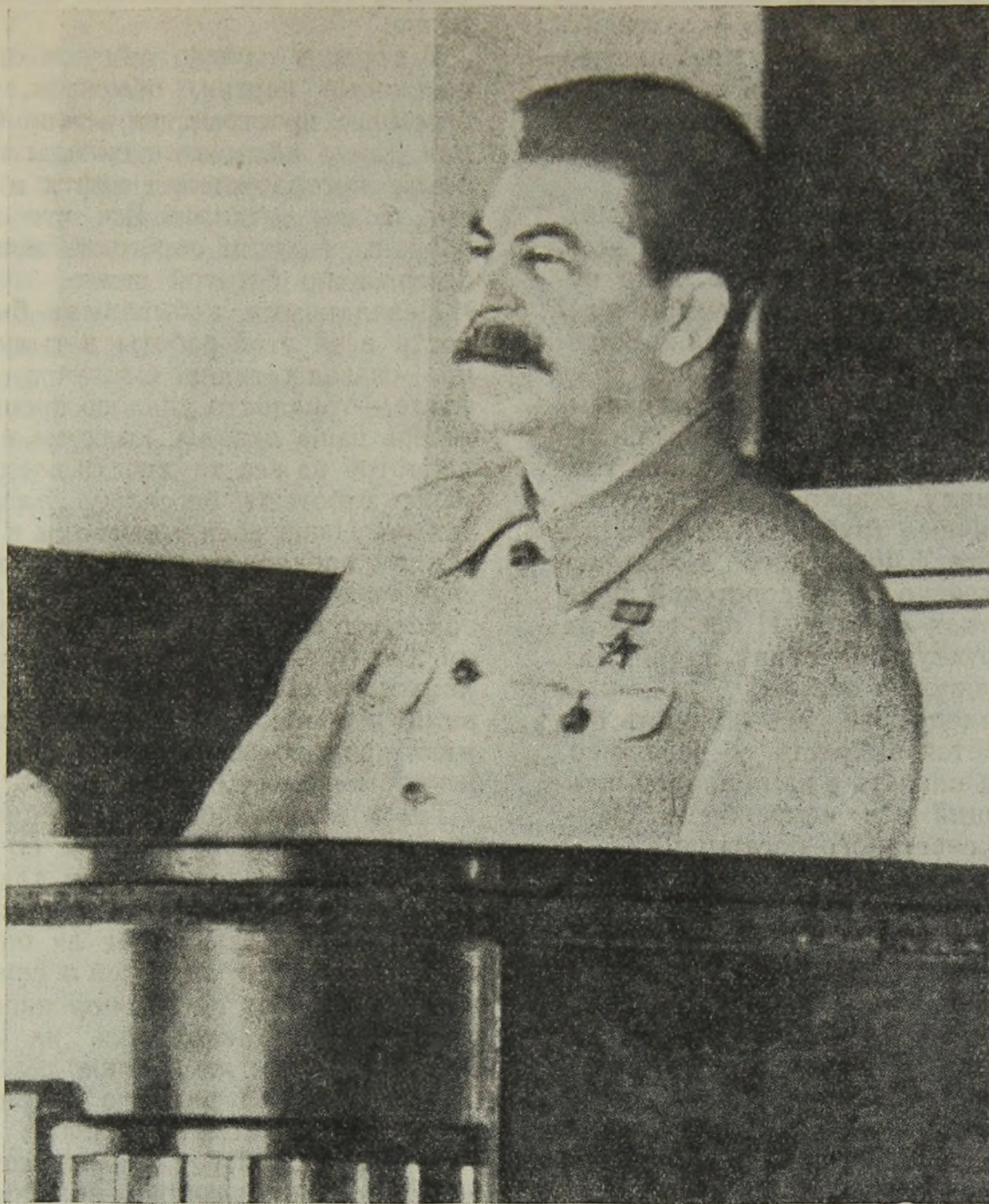
И. В. Сталин на трибуне 6 ноября 1942 года.