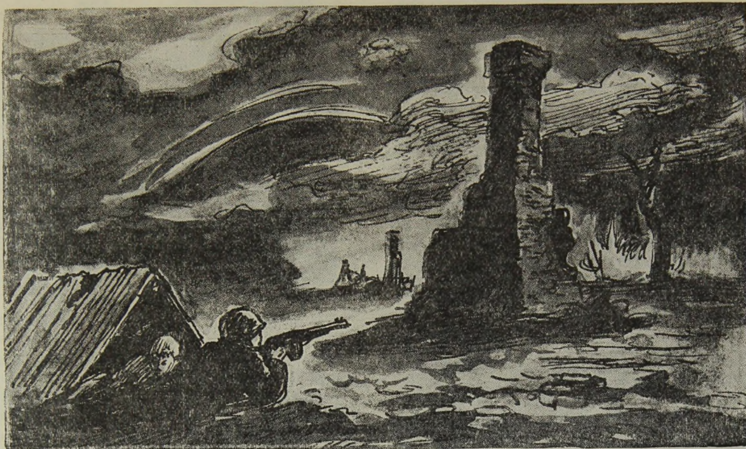
Перевалившись на живот, он приложился и нажал спусковой крючок.

С трудом отворотив набухшую дверь, он спустился по ступенькам немного вниз и окликнул: