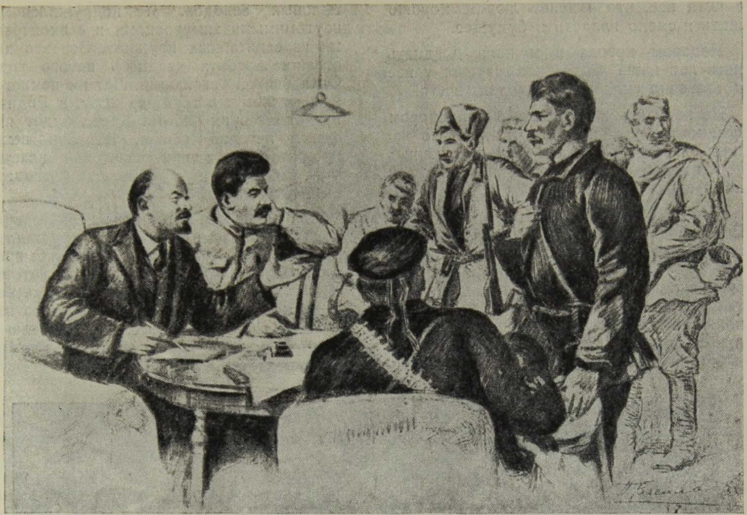
П. Васильев «В. И. Ленин и И. В. Сталин беседуют с красногвардейцами в Смольном».