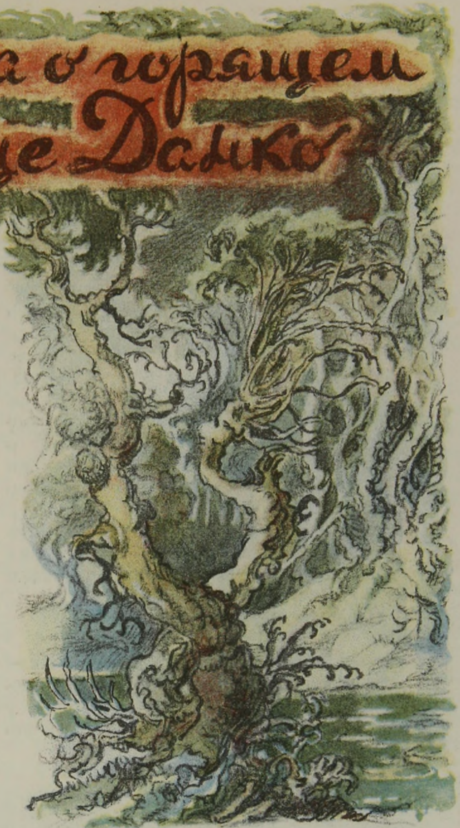
Рисунки В. Таубера

Ж ИЛИ на земле встарину одни люди, непроходимые леса окружали с трех сторон таборы этих людей, а с четвертой — была степь. Были это веселые, сильные и смелые люди. И вот пришла однажды тяжелая пора: явились откуда-то иные племена и прогнали прежних в глубь леса. Там были болота и тьма, потому что лес был старый, и так густо переплелись его ветви, что сквозь них не видать было неба, и лучи солнца едва могли пробить себе дорогу до болот сквозь густую листву. Но когда его лучи падали на воду болот, то подымался смрад, и от него люди гибли один за другим. Тогда стали плакать жены и дети этого племени, а отцы задумались и впали в тоску. Нужно было уйти из этого леса, и для того были две дороги: одна — назад, — там были сильные и злые враги, другая — вперед, — там стояли великаны-деревья, плотно обняв друг друга могучими ветвями, опустив узловатые корни глубоко в цепкий ил болота. Эти каменные деревья стояли молча и неподвижно днем, в сером сумраке, и еще плотнее сдвигались вокруг людей по вечерам, когда загорались костры. И всегда, днем и ночью, вокруг тех людей было кольцо крепкой тьмы, оно точно собиралось раздавить их, а они привыкли к степному простору. А еще страшней было, когда ветер бил по вершинам деревьев и весь лес глухо гудел, точно грозил и пел похоронную песню тем людям. Это были все-таки сильные люди и могли бы они пойти