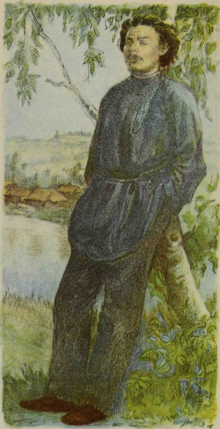
Максим Горький (1902 год).