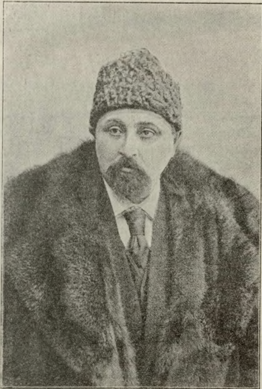
Димитрій Наркизовичъ Маминъ-Сибирякъ.