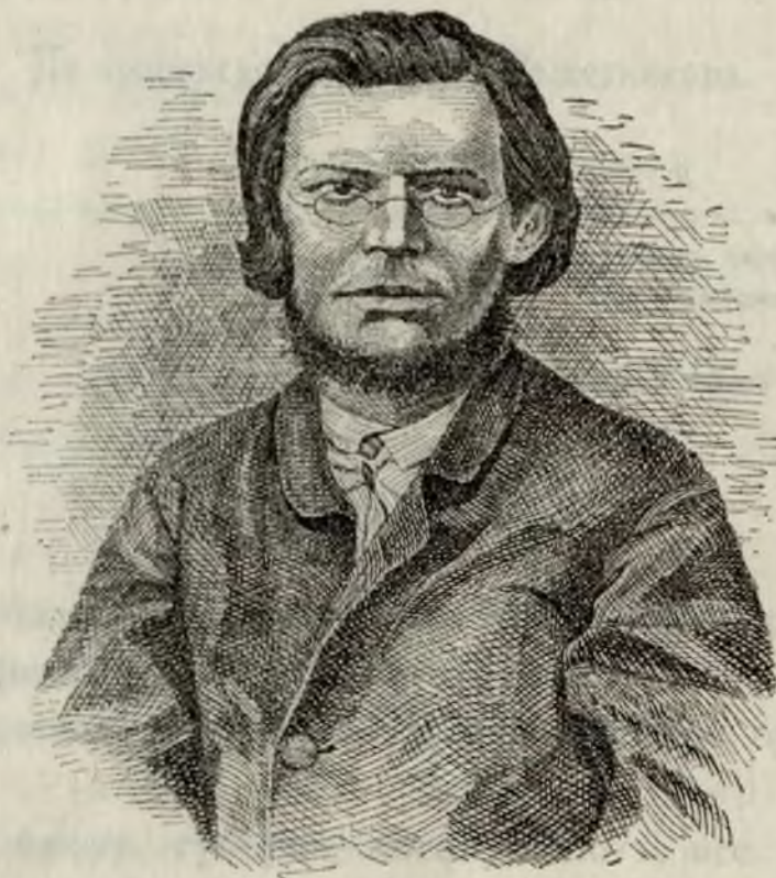
Федоръ Михайловичъ Рѣшетниковъ.